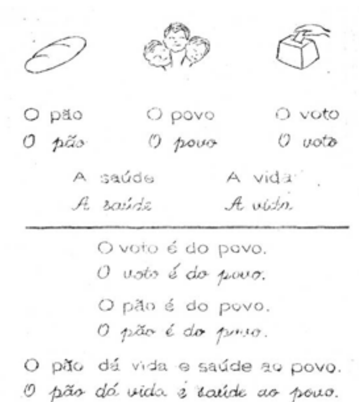
Fig. 6: Conteúdo de aprendizagem da cartilha

Essa filosofia tinha base no artigo 166 da Constituição do Brasil, que diz: “A educação é direito de todos e deve inspirar-se nos princípios da liberdade, nos ideais de solidariedade humana” (GÓES, 1980, p.128). A primeira lição consistia no “voto do povo”, considerando o voto como uma expressão democrática, como o poder de decisão do povo e a compreensão da sua responsabilidade na vida da nação.