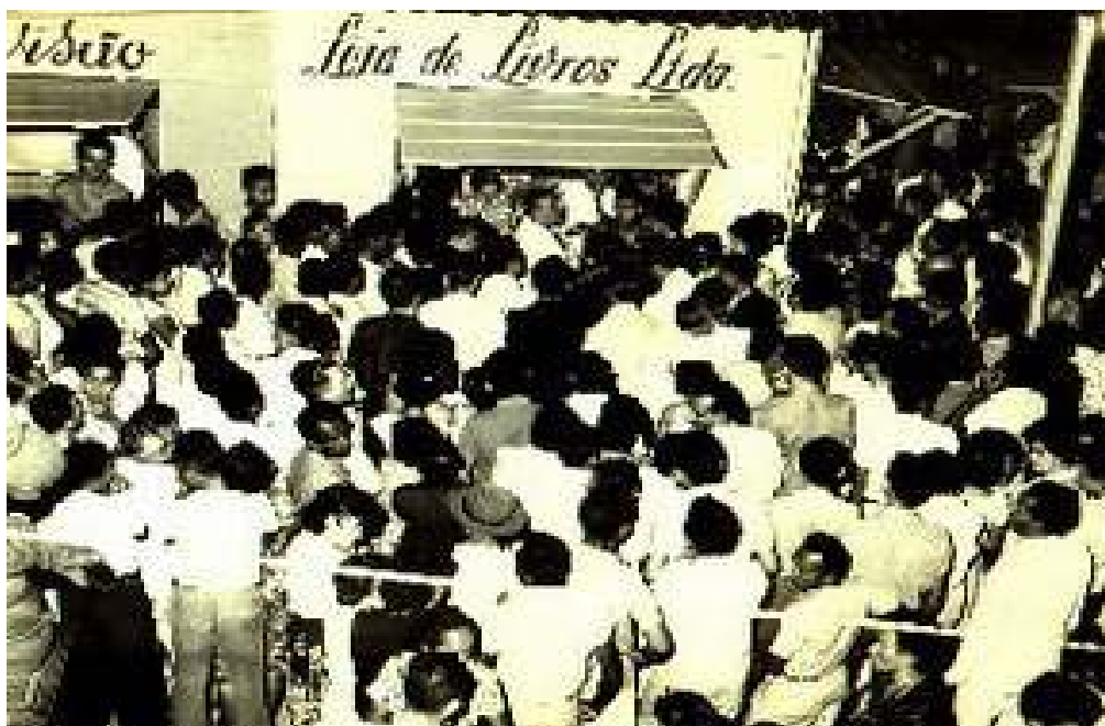
Fig. 8: Venda de livros na terceira Praça de Cultura

emprestavamos por mês 2 mil a 2.500 livros em bairros periféricos, como Rocas e Quintas” M:1 .