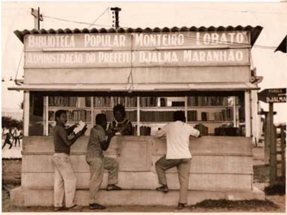
Fig. 7: Biblioteca Popular Monteiro Lobato

A campanha apresentava o seguinte slogan: “O livro que sobra na sua biblioteca falta na mão do povo”. Em decorrência do sucesso dessa campanha, surgiu a primeira biblioteca no bairro das Rocas, que consistia numa forma criativa de interferir na comunidade, possibilitando às crianças, aos jovens e aos adultos a acessibilidade aos livros e à cultura .