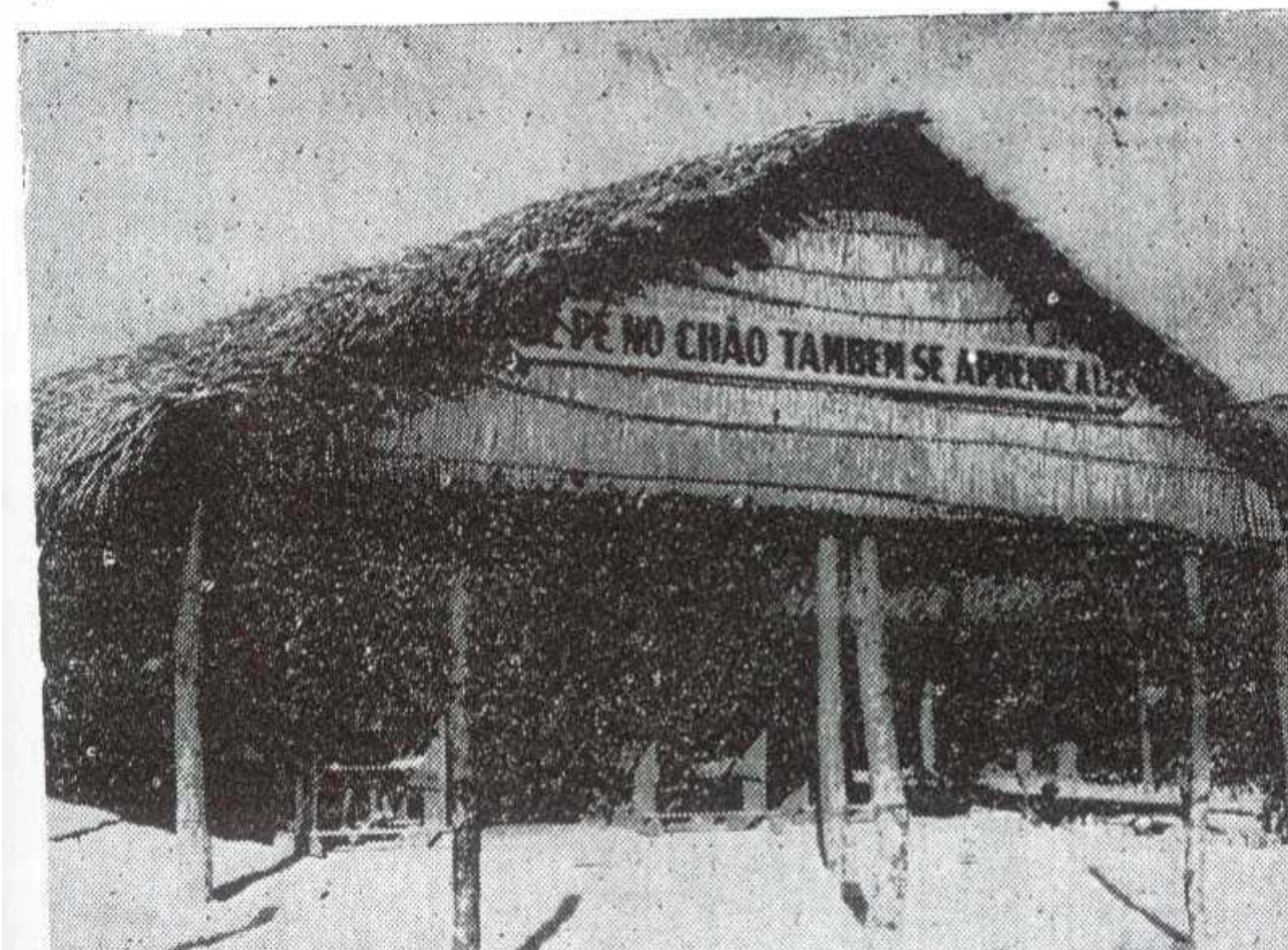
Fig. 2: Acampamento escolar – Rocas

Esses acampamentos funcionavam em três turnos. Inicialmente, nas Rocas e no Carrasco (1961) hoje bairro das Quintas; a partir de 1962, expandiram-se para os seguintes bairros: Quintas, Conceição (hoje Lagoa Seca), Granja (Trecho das Quintas que antecede Igapó), Nova Descoberta, Nordeste, Aparecida e Igapó. A equipe que integrava os acampamentos geralmente compunha-se de diretor (professor com titulação vinculada à Escola Normal de Natal), que geralmente acumulava as funções de gestor